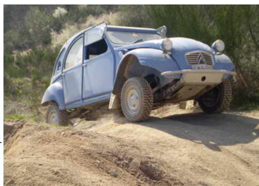
▲ Crapadeuche, comme crapahuter en Deuche... Bien équipée, et guidée par des mains expertes, la 2 CV prouve une fois de plus qu'elle passe partout.

> Pierre Focant : 0032 (0) 49 522 11 98 > Thierry Gaudin : 0032 (0) 47 835 90 19 > Site Internet : www.deuche.be (rubrique Crapadeuche) > Email : crapadeuche@live.be