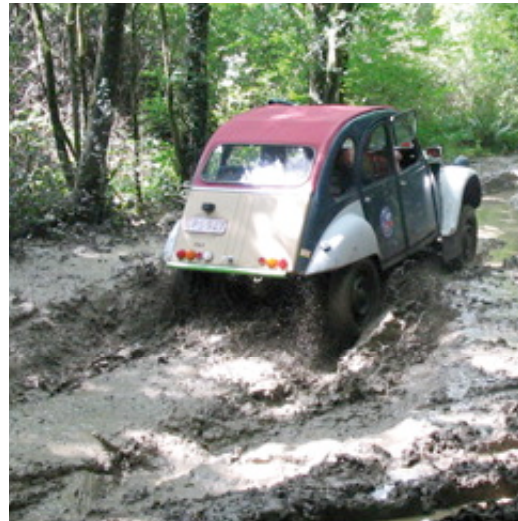
▲ Tout terrain n'est pas ici qu'une simple expression... Mais une 2 CV belge n'a pas pour habitude de se laisser décourager par la boue des chemins forestiers.

Ainsi naît, la même année Crapadeuche, une amicale sans statuts. Pas plus de responsables aux commandes, mais des acteurs, et par-dessus tout des amis. À l'origine, le groupe est constitué d'un noyau dur de dix Belges francophones, qui se réunissent autant qu'ils le peuvent dans le garage de l'un ou de l'autre. Ces mêmes personnes organisent, au moins une fois