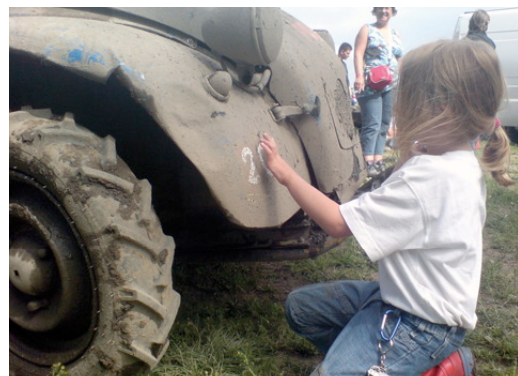
▲ La boue séchée sur l'aile d'une 2 CV n'impressionne pas les plus jeunes membres de l'Amicale. Au pire, ils l'utilisent comme tableau noir...

par mois, des sorties sur terrain privé, ou dans le cadre d'organisations qui leur permettent d'évoluer avec leurs Deuches extrêmes. Une rubrique Crapadeuche est ouverte, sur le site Internet de La Vie à Deuche . Véritable portail interactif, elle permet de s'inscrire à