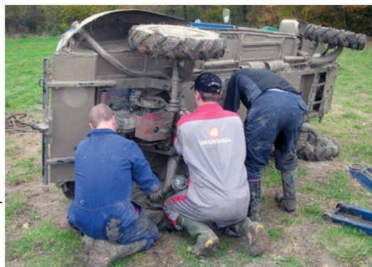
▲ Sur de tels terrains, et malgré les renforts, personne n'est à l'abri de la casse. Les problèmes sont vite résolus entre amis experts en mécanique.

Ainsi naît, la même année Crapadeuche, une amicale sans statuts. Pas plus de responsables aux commandes, mais des acteurs, et par-dessus tout des amis. À l'origine, le groupe est constitué d'un noyau dur de dix Belges francophones, qui se réunissent autant qu'ils le peuvent dans le garage de l'un ou de l'autre. Ces mêmes personnes organisent, au moins une fois